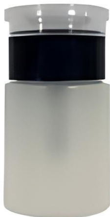
Frasco para alcohol