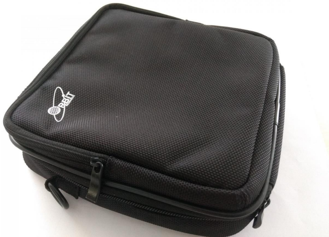
Bolso Carrying Case